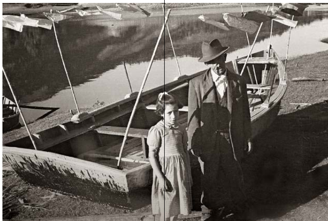
Xoaquín Lorenzo Fernández Barca de Barbantes, 1950 ca. MUSEO ARXEOLÓGICO PROVINCIAL DE OURENSE